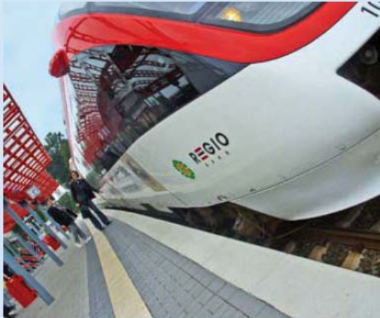
Seit 10 Jahren bricht die Regiobahn alle Rekorde.

ihren Anteil: Die neuen, klimatisierten Dieseltriebwagen vom Typ Talent werden täglich von innen gereinigt und an jeder Endstation vom Triebfahrzeugführer auf Sauberkeit überprüft. Einmal pro Woche fahren sie in die Waschstraße zur Außen-Säuberung. Das unternehmenseigene Kundencenter in Mettmann dient als Anlaufstelle für alle Fahrgäste. Taschenfahrpläne gehen an alle Haushalte im Einzugsbereich. Fantasiervolle Events beleben Strecke und Stationen, zum Beispiel Auftritte von Nikoläusen, „jecke Bahnen“ im Karneval oder eine individuelle Frisurberatung während der Fahrt. 2009 feiert das Unternehmen sein 10-jähriges Jubiläum mit einem Sommerfest für alle Fahrgäste. All das trägt zur Identifikation der Kunden mit „ihrer Regiobahn“ bei.