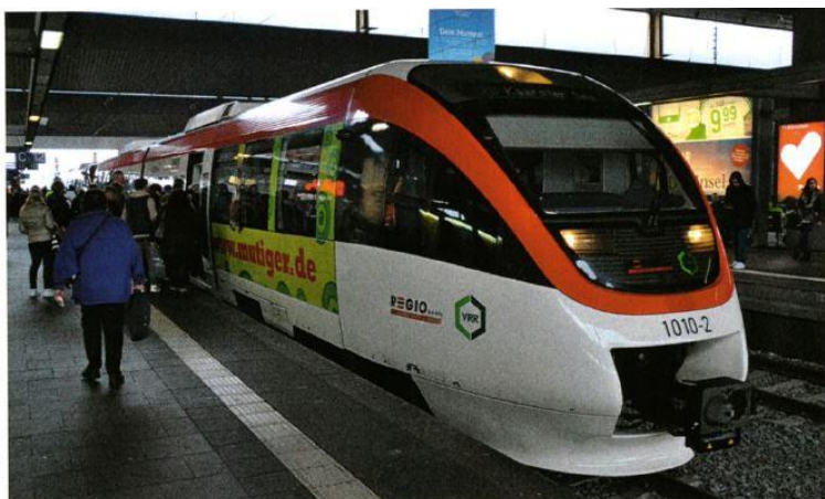
Die S 28 ist eine der beliebtesten Linien im VRR.

Wie zufrieden sind Sie mit der Pünktlichkeit? Wie freundlich sind die Servicemitarbeiter? Wie oft ist der Fahrkartenautomat defekt? Solche und ähnliche Fragen werden bei rund 300 Befragungen im Rahmen der Kundenzufriedenheitsmessung durch speziell geschultes Personal des Verkehrsverbundes Rhein-Ruhr AÖR gestellt und von den Fahrgästen im Schienenpersonennahverkehr (SPNV) beantwortet. Darüber hinaus wird jedes Eisenbahnverkehrsunternehmen im VRR von Profi-Testern des Verkehrsverbundes mindestens 140 Mal pro Jahr kontrolliert.