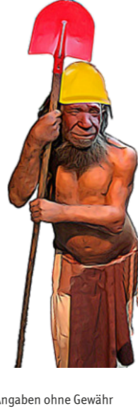
Alle Angaben ohne Gewähr